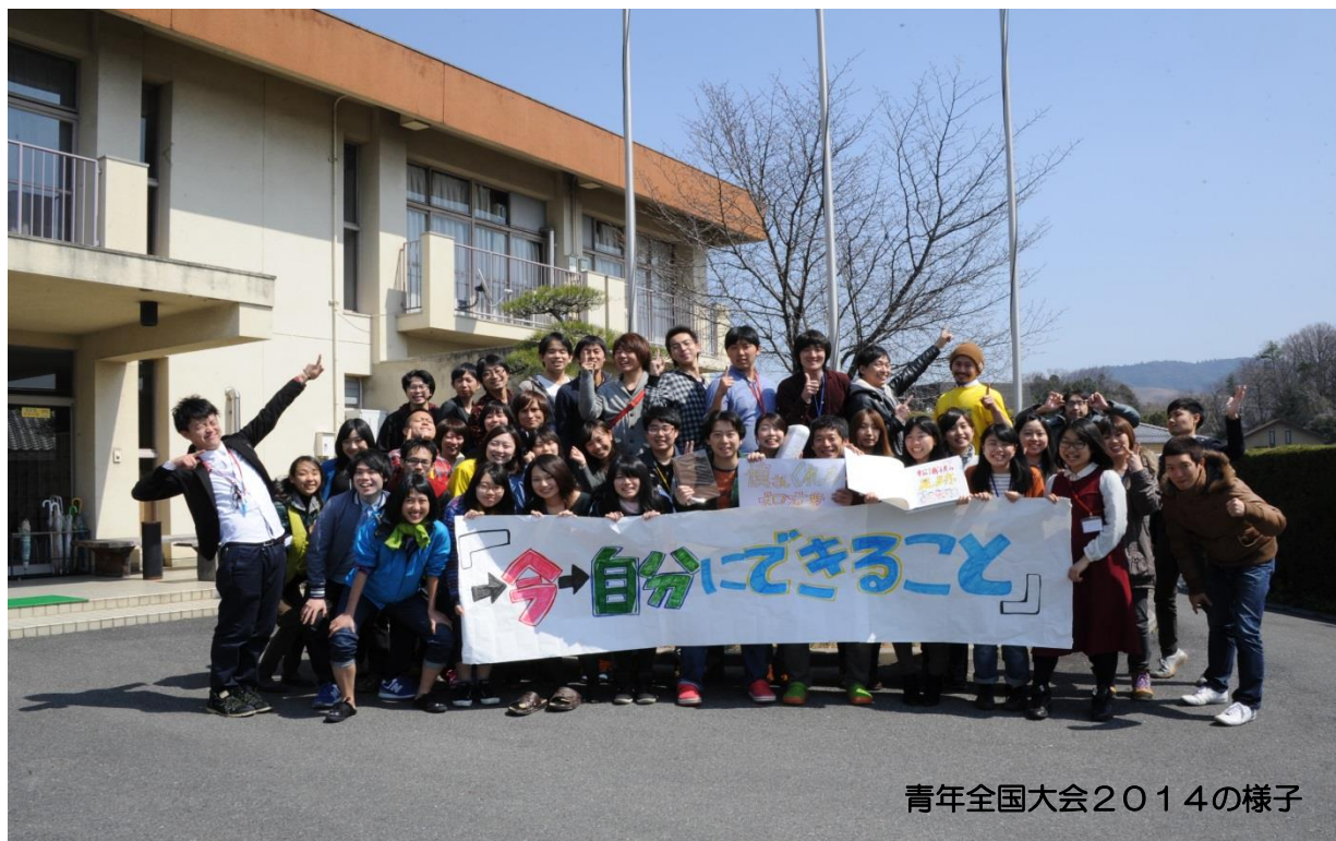
青年全国大会2014の様子